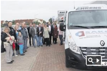
Sponsoren des Vereinsmobils freuen sich über die gelungene Kooperation für Garbsen.

29 Garbsener Firmen beteiligen sich mit Ahrens an dem Projekt Vereinsmobil für Garbsen